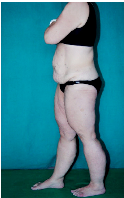
Abb. 3 Patientin aus Abb. 1 und 2, 11 Monate nach erfolgter bariatrischer OP. Das Gewicht betrug jetzt 74 kg, der BMI lag bei 26 kg/m 2 .