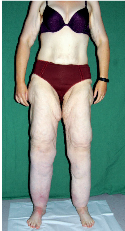
Abb. 6 Patientin aus Abb. 5, ein Jahr später, nach Magenbypass-OP