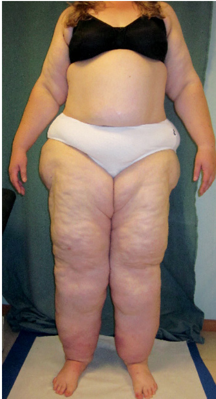
Abb. 5 Patientin mit Lipödem und inzwischen auch distal betontem Beinlymphödem