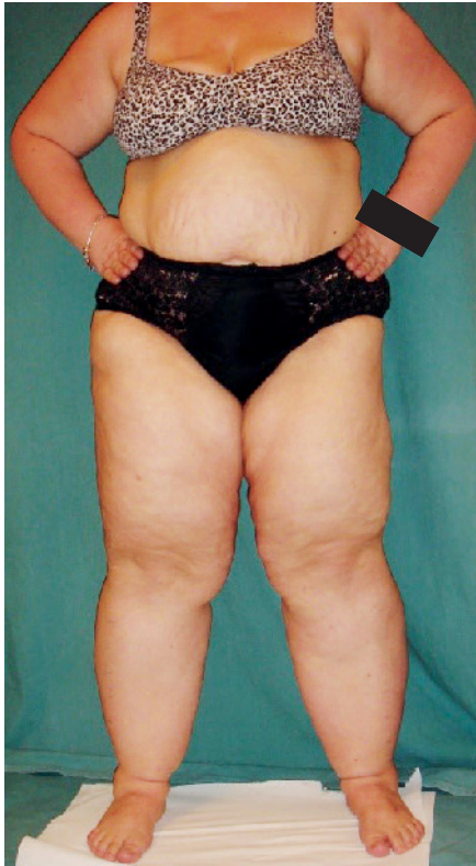
Abb. 1 Lipödempatientin (Gewicht 122 kg, Größe 168 cm, BMI 43 kg/m 2 ) vor Schlauchmagenoperation. Das Beinvolumen beträgt hier je Bein 19 Liter)