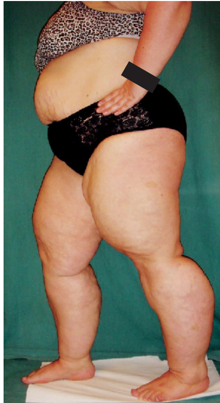
Abb. 2 Lipödempatientin (Gewicht 122 kg, Größe 168 cm, BMI 43 kg/m 2 ) vor Schlauchmagenoperation. Das Beinvolumen beträgt hier je Bein 19 Liter)