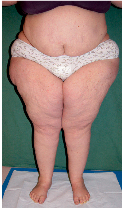
Abb. 1 Patientin mit Lipohypertrophie der Oberschenkel und der Beckenregion

Dieser Mangel an objektiven und klaren Diagnosekriterien führt auch dazu, dass keine verlässlichen Zahlen zur Prävalenz des Lipödems existieren. Weit überwiegend wird die Diagnose Lipödem von lymphologisch unerfahrenen Kollegen und fast noch häufiger von den Patientinnen selbst gestellt. In unserem Patientengut ist die Diagnose Lipödem (und noch häufiger die Diagnose „Lipolymphödem“) die mit Abstand häufigste Fehldiagnose, die wir täglich sehen. Alle – auch in wissenschaftlichen Publikationen – kursierenden Zahlen zur Prävalenz entbehren jeglicher Evidenz